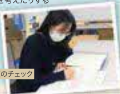
申請書類のチェック

生活の根拠を守る土木という仕事は、裏方ではありますがやりがいのある仕事です。今住んでいる鳥取県をより良くしたいと思っている方、ぜひ一緒に働きましょう。コミュニケーションが取りやすく、風通しの良い職場ですよ。