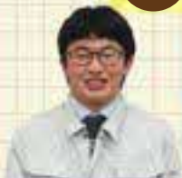
県土整備部 八頭県土整備事務所 道路整備課 令和6年度新規採用 Bさん

この仕事を選んだきっかけは? 私の自宅はわかさ氷ノ山スキー場に繋がる国道沿いにあります。道が狭く、特に冬は通行が大変でしたが、令和元年にトンネルができて利便性が良くなったことで土木の力を知り、この道に進みたいと思うようになりました。