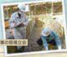
ため池改修工事の現場立会

小学校への出前授業を行った際、お礼の手紙を貰ったことが心に残っています。また、地元へ工事費用を負担いただく場合など調整に苦労することもありましたが、工事が無事終わって「ありがとう」とお声がけいただいた時は嬉しかったです。