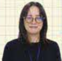
県土整備部 河川港湾局 治山砂防課 平成15年度入庁 Aさん

仕事内容は? 砂防ダム等の工事に必要な予算確保や各種申請のほか、土砂災害の恐れがある区域を調査し、警戒区域の指定・見直しをするなど、災害から命を守ることが私たちの仕事です。他の自治体との意見交換、市町村や国との調整など業務は多岐にわたります。