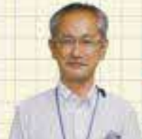
農林水産部 農業振興局 農地・水保全課 平成23年度入庁 Cさん

仕事内容は? 農家の皆さんの声を聴いて田畑や水路、ため池に関する要望や困りごとを把握し、交付金事務や予算管理、政策立案を行っています。本庁では、国・県の地方機関・市町村とのやり取りや事務仕事を中心ですが、外へ出て一日中現場を回る日もあります。